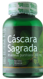
Cáscara Sagrada Rhamnus purshiana 300 mg