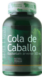
Cola de Caballo Equisetum arvense 300 mg