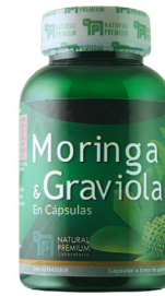
Moringa Graviola Moringa oleifera Annona muricata 300 mg