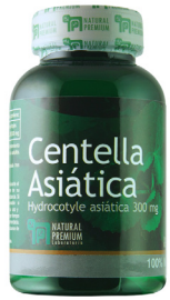
Centella Asiática Hydrocotyle asiatica 300 mg