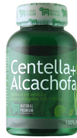
Centella + Alcachofa Hydrocotyle asiatica Cynara scolymus 120/180 mg