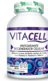
Vitacell Regenerador celular