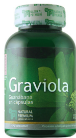
Graviola Annona muricata 300 mg