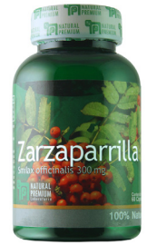
Zarzaparrilla Smilax officinalis 300 mg