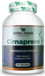
Cinaprem Trastornos Dispépticos Antiespasmódico