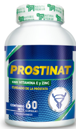
Prostinat Cuidado y Salud de la Próstata