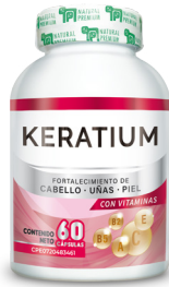
Keratium Fortalecimiento de cabello, uñas y piel