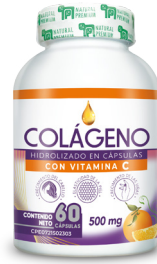
Colágeno con Vitamina C Colágeno Hidrolizado 470 mg