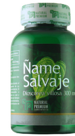
Ñame Salvaje Dioscorea villosa 300 mg