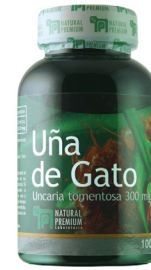
Uña de Gato Uncaria tomentosa 300 mg