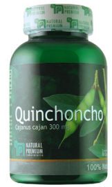
Quinchoncho Cajanus cajan 300 mg