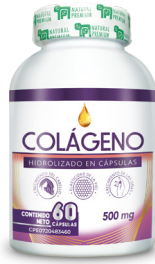
Colágeno Colágeno Hidrolizado 500 mg