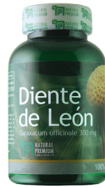
Diente de León Taraxacum officinale 300 mg