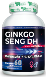
Ginkgo Seng DH Energía y Vitalidad