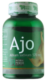
Ajo Allium sativum 570 mg