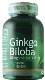
Ginkgo Biloba Ginkgo biloba 300 mg