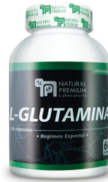
L-Glutamina L-Glutamina 500 mg