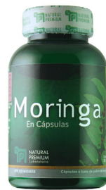
Moringa Moringa oleifera 300 mg