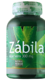
Zábila Aloe vera 300 mg