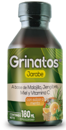
Grinatos Maloji, Jengibre, Miel, Vitamina C Sabor a menta