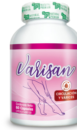
Varisan Circulación y Várices